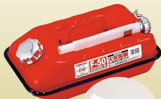
F-50 5 リットル