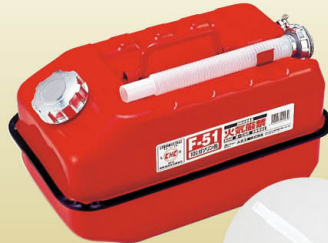
F-51 10 リットル