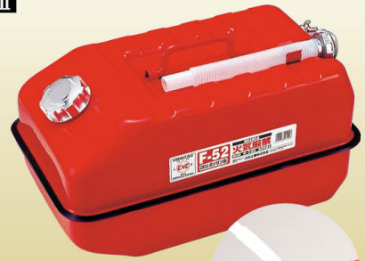
F-52 20 リットル