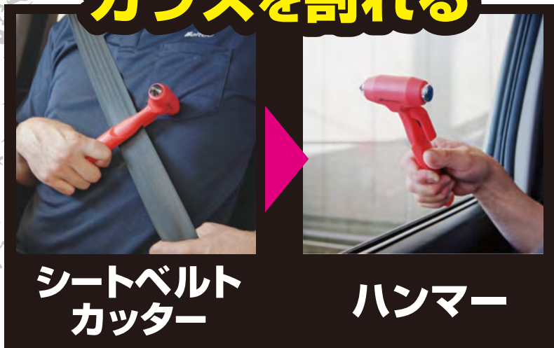
シートベルト カッター