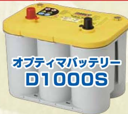
オプティマバッテリー D1000S